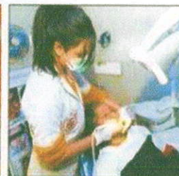
दांतों की सफाई कराती डॉक्टर।

के दांतों में कीड़े मिले। जिसकी वजह से उनके दांतों में दर्द होता था। आगे के इलाज के लिए उन्हें अस्पताल बुलाया गया है। कई लोगों के दांत गंदे मिले। दांत साफ करवाने