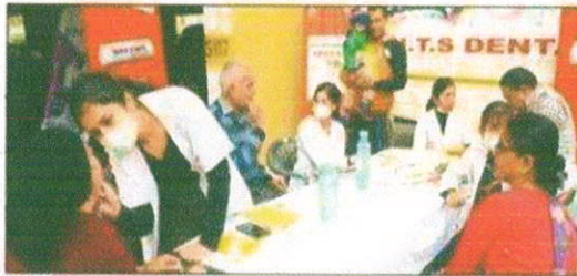
ग्रेनो वेस्ट की पंचशील हायनिश सोसाइटी में दांतों की जांच कराते लोग।

सब्स ही लोगों को परामर्श भी दिया गया। चिकित्सकों ने बताया कि तंबाकू और सिगरेट से दांत खराब हो रहे हैं। रविवार सुबह साढ़े दस बजे शिविर शुरू हुआ। जो कि दोपहर दो बजे तक चला। इस दौरान