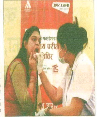
नोएडा सेक्टर-56 में निशुल्क शिविर में दांतों की जांच करती डॉक्टर।