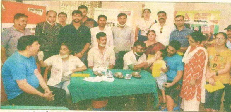
अमर उजाला फाउंडेशन की तरफ से ग्रेटर नोएडा वेस्ट के अजानारा होम्स सोसायटी में लगे शिविर में दांतों की जांच कराते सोसायटी निवासी।