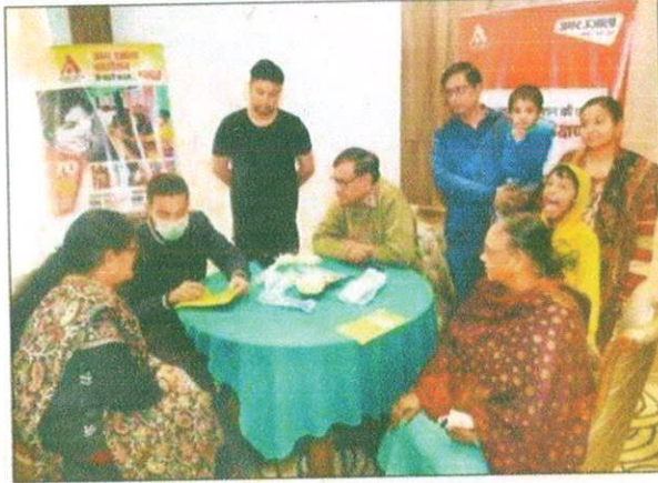
ग्रेटर नोएडा वेस्ट स्थित अरिहंत आर्डेन सोसायटी में आयोजित शिविर में जांच कराते लोग।

लोगों ने उठाया शिविर का लाभ रक्तचाप की भी की गई जांच