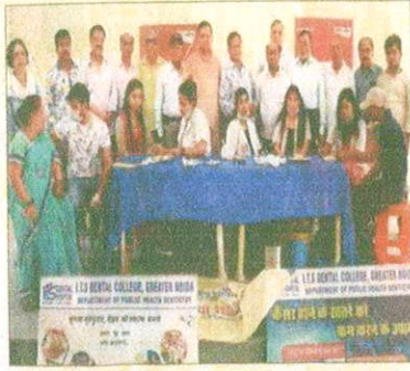
अमर उजाला फाउंडेशन के शिविर में मरीजों की जांच करते डॉक्टर।

सेक्टर-56 में अमर उजाला फाउंडेशन ने आईटीएस डेंटल कॉलेज के सहयोग से लगाया निशुल्क दंत जांच शिविर